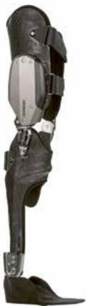
Eine moderne Orthese: Die computer-gesteuerte C-Brace schafft völlig neue der Bewegungsmöglichkeiten, wie das Beugen des Beines beim Hinsetzen oder das Laufen in unebenem Gelände.

Fachleute immer individuell. Ein Zuschnitt, der am Schienbein geschlossen ist, wirkt sich zum Beispiel kniestabilisierend aus. Mit speziellen Knöchelgelenken können eine hebende oder senkende Fussführung und eine Bewegungslimitierung erzielt werden.