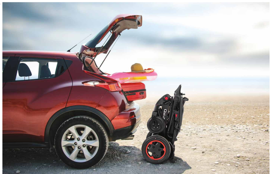
Photographie 7: Le fauteuil roulant électrique Quickie Q50R se plie facilement et s'empporte en vacances.

Les patients atteints de sclérose en plaques (SEP) sont un exemple classique. Ils peuvent encore marcher tout seuls, mais à l'extérieur cela devient de plus en plus difficile. Souvent, ils ne sont pas encore prêts pour un fauteuil