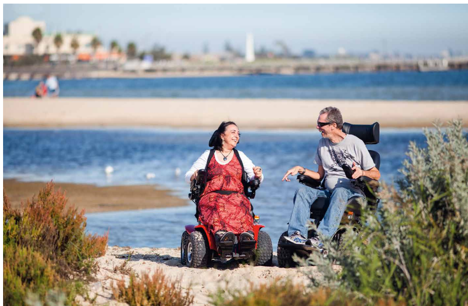
Photographie 4: Avec ses quatre roues motrices, le Magic Mobility Extreme X8 est le compagnon idéal dans la nature.

En Suisse, deux modèles se sont imposés : le Magic Mobility Extreme X8 et le JST Mountain Drive. Le X8 est doté de quatre roues motrices, mais n'est pas adapté à la ville en raison de ses gros pneus ballon qui s'usent très rapidement sur l'asphalte. Doté de possibilités de réglage plus nombreuses que le JST, il s'adresse aux personnes fortement handicapées. Le JST est un modèle à deux roues motrices qui dispose d'un système spécial pour équilibrer le poids.