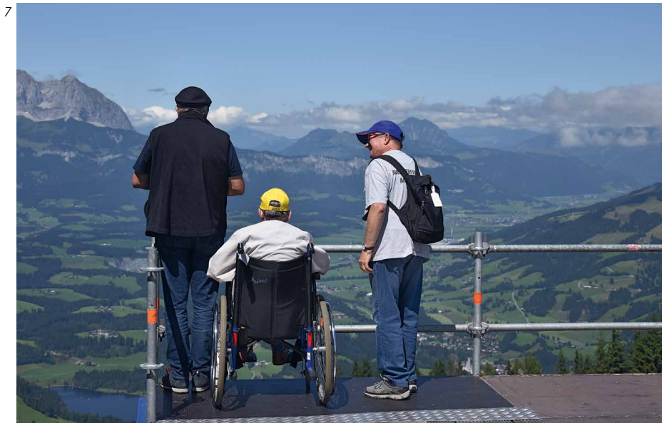
Photographie 8: En Suisse, il existe de nombreux sentiers de randonnée accessibles en fauteuil roulant, par exemple le Chemin des berges du Rhône.